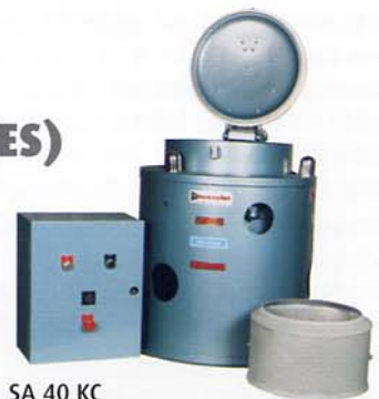
SA 40 KC