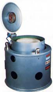
SA 50 KCC2

ET AUTRES INDUSTRIES (PLASTIQUES, TEXTILES, AGRO-ALIMENTAIRES)