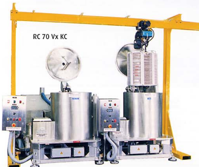
RC 70 Vx KC