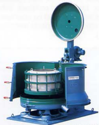
RC 40 Vx KCC2