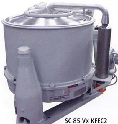
SC 85 Vx KFEC2