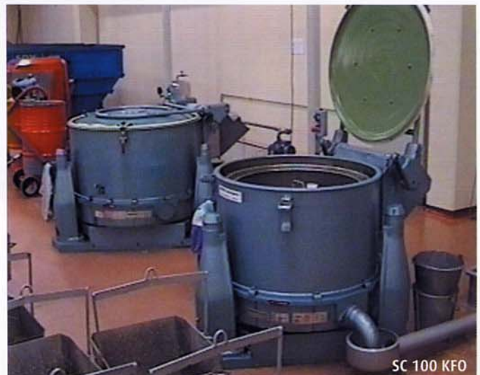
SC 100 KFO